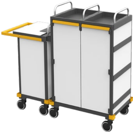
Equipe Hôtel HI «Platinum White» N° art. 16668305

Grâce à son concept modulaire, le chariot d'hébergement Equipe Hôtel s'adapte à vos exigences. Voici quelques exemples de configurations.