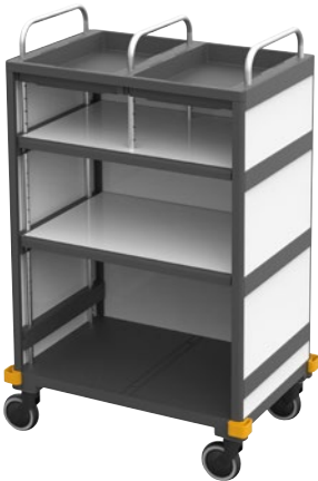
Equipe Hôtel H3 «Platinum White» N° art. 16668105