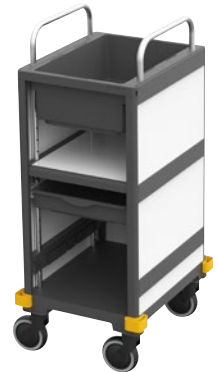
Minibar Equipe «Platinum White» N° art. 16668905