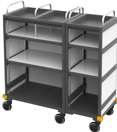
Equipe Hôtel, grand «Platinum White» N° art. 16668405